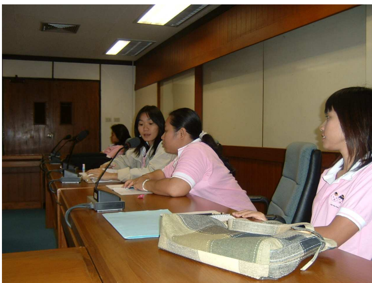
ข้างหลัง มุมที่เลี้ยง สวยทุกคนคะ