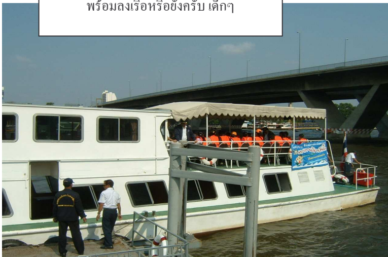
เรือกรมเจ้าท่า เรือของพวกเราวันนี้