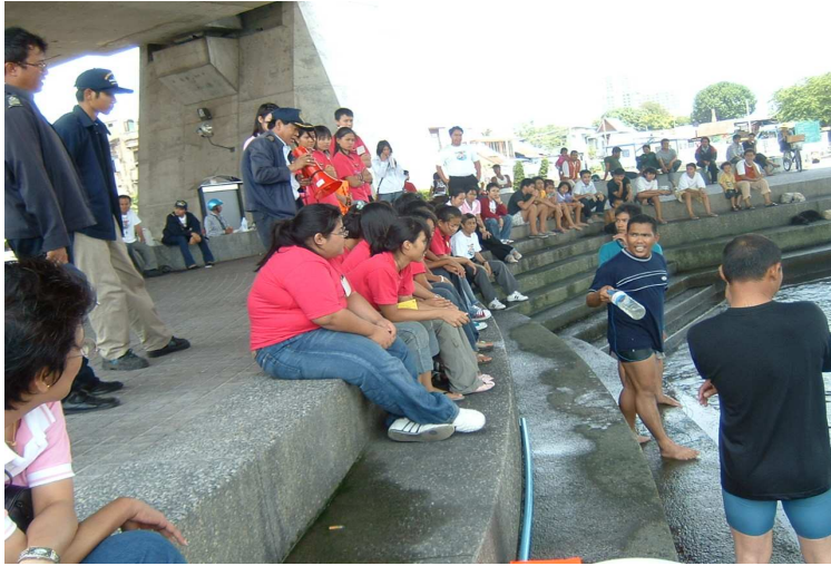
สาธิตการช่วยเหลือคนจมน้ำ โดยใช้อุปกรณ์ข้างเคียง