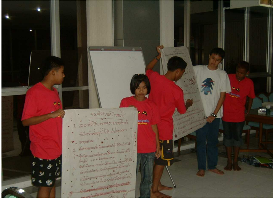
ออกมานำเสนองาน ที่คิดร่วมกันในกลุ่ม