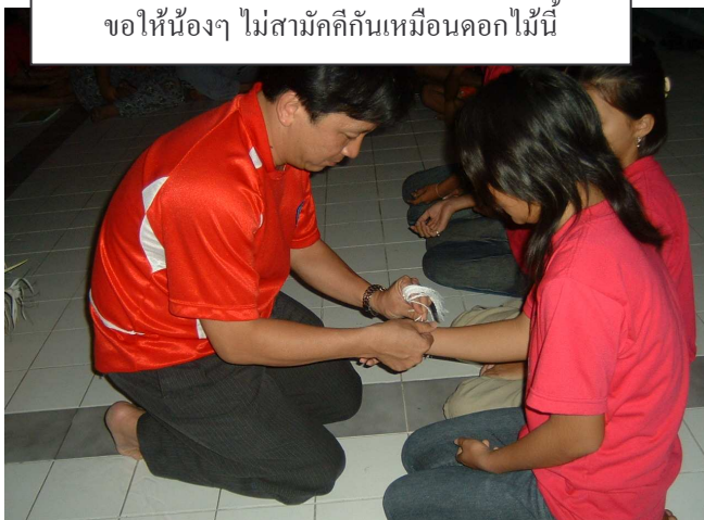
พิธี ผูกข้อมืออวยพร