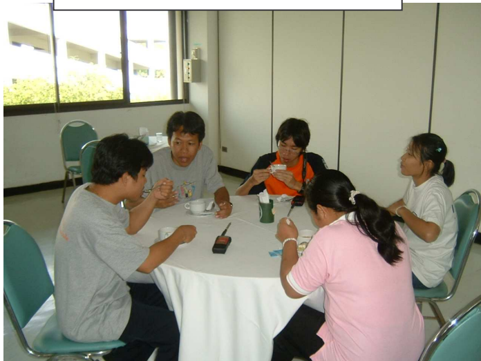
พูดมากชักหิวแล้วครับ ขอกินก่อนนะ