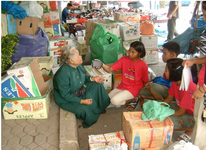
คุณยาย คะ ขอสัมภาษณ์หน่อยกะ