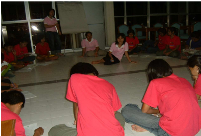
วันนี้ ได้อะไรกันมาบ้างจ๊ะเด็กๆ