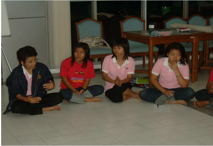
พี่ตุ๊ก ชี้แจงกิจกรรมในวันพรุ่งนี้ ก่อนเข้านอน