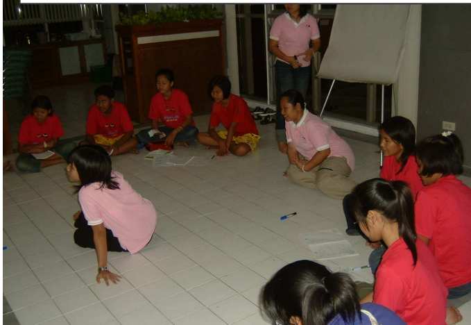
สรุปกิจกรรมช่วงเช้า นำโดยป้าหมู