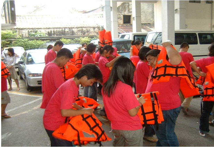
เด็กไทยปลอดภัย ต้องใส่ชูชีพ ก่อนลงเรือ