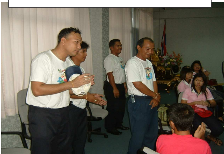
ทีมวิทยากรจาก โครงการเยาวชนรักขน้้ำ