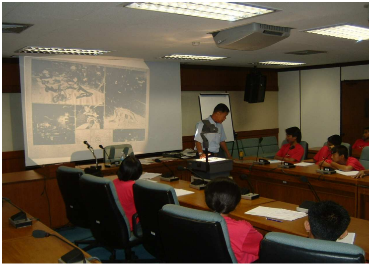
เข้าใจมัย ฮี หนุ่ม