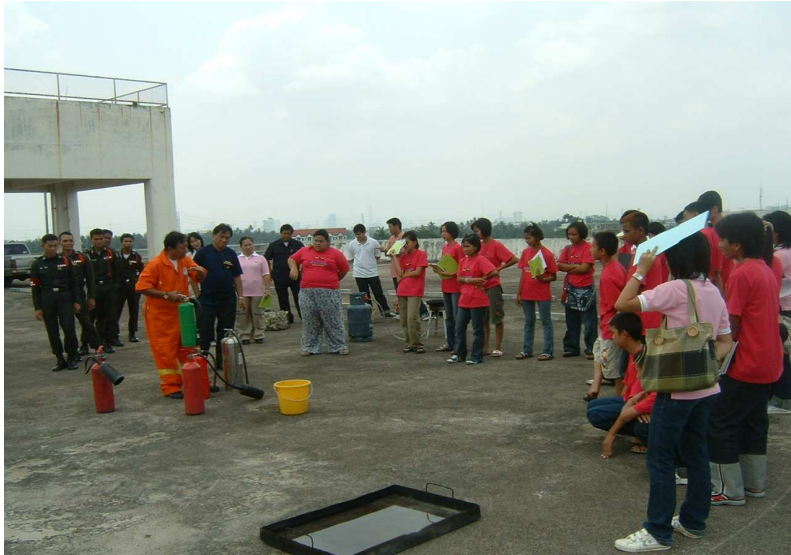
คุณตำรวจ แนะนำถังดับเพลิงชนิดต่างๆ