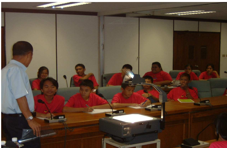
ครับ ครับ ผมตั้งใจฟังคุณตำรวจอยู่ครับ