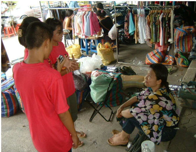
“เออ ขอโทษค่ะ คุณป้า พวกหนูขอสัมภาษณ์หน่อยนะคะ”