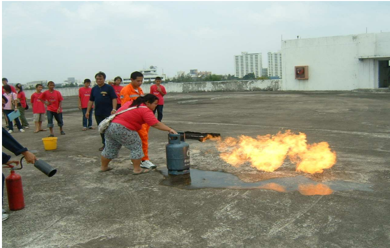
เอ๊ะ เอ๊ะ ทำไมถึงแก๊ซ มี 2 ถัง