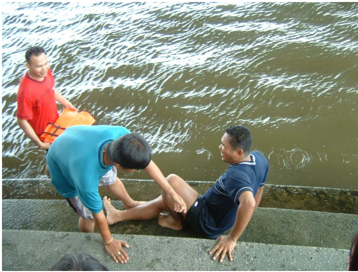
วัดความสิ้นสะท้อนได้ 7.8 ริกเตอร์ (ล้มคร่าบ)