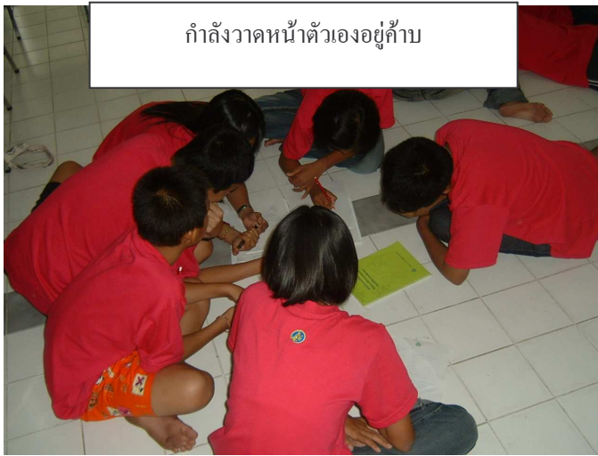
หลังจากสนทนากันแล้ว ก็มาใช้ความคิดกัน