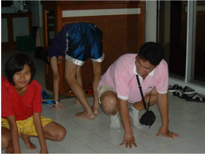
โถ โถ.. ชะตากรรมของผู้แพ้