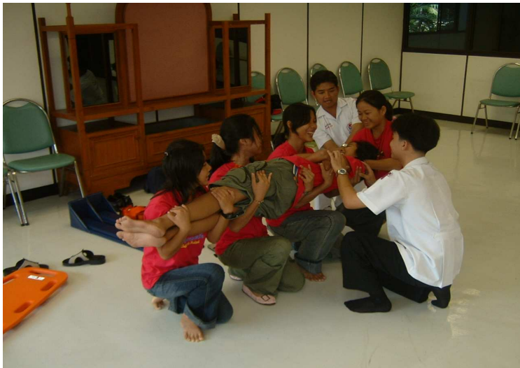
หนึ่ง สอง สาม อีบ !!