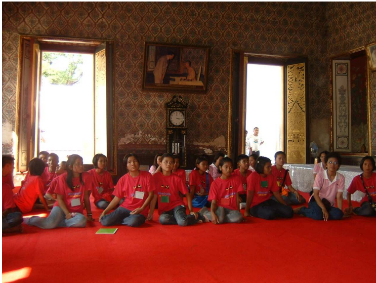
แวะเยี่ยมชม วัดเฉลิมพระเกียรติ