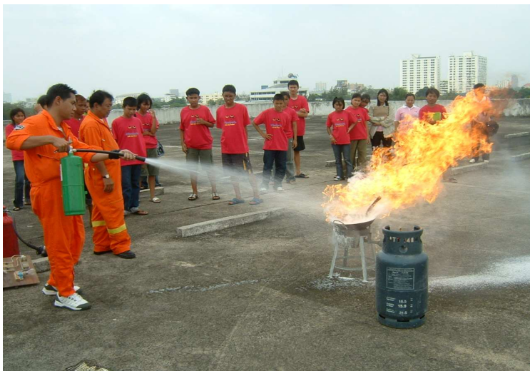
สาธิตการดับเพลิง ของภาชนะบนเตา