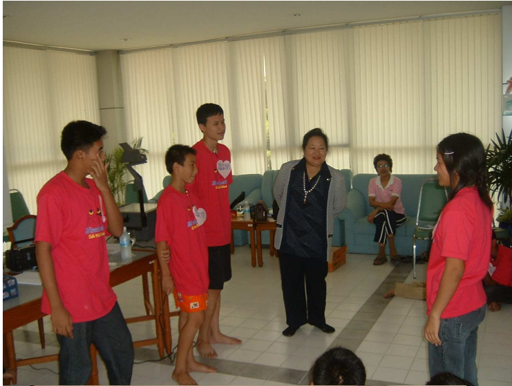
เฮ้า ซี้ตัวผู้ต้องหาเลขหนู