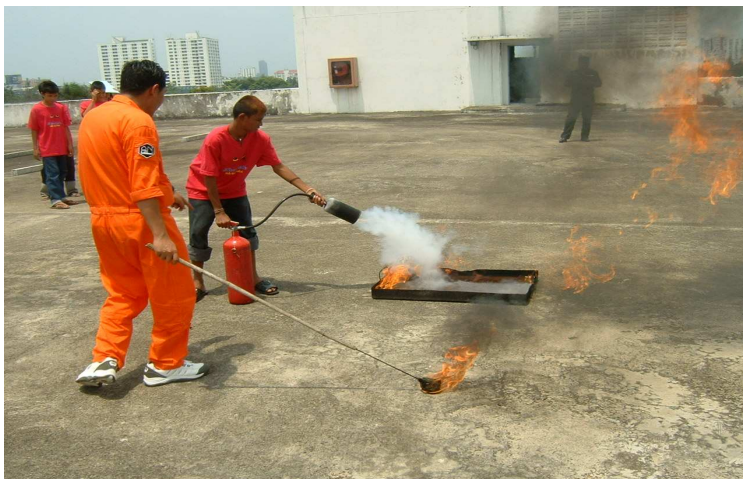
สอนการดับเพลิงในกระบอกน้ำมัน