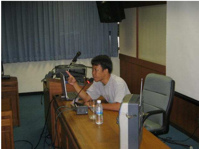
เป็นยังไงบ้างน้องๆ สัมภาษณ์วันนี้