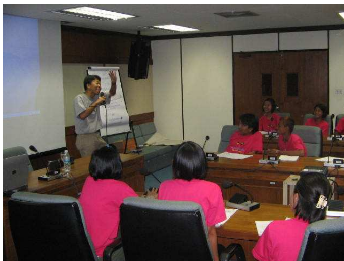
เป็นผู้นำต้องกล้าแสดงออกนะน้อง (คูพี่เป็นตัวอย่าง)