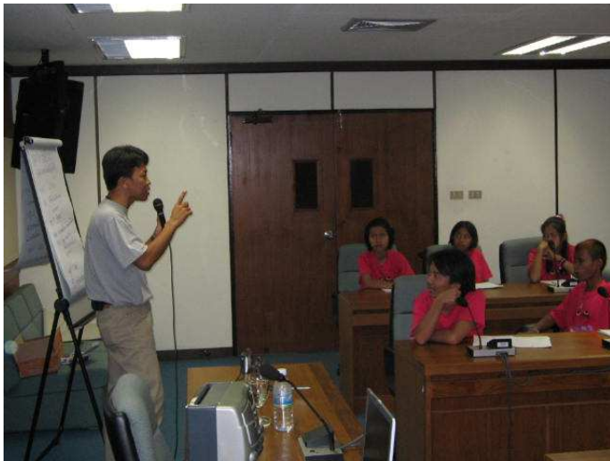
วันนี้ได้สนุกกันแน่ครับ พี่ใจรับรอง