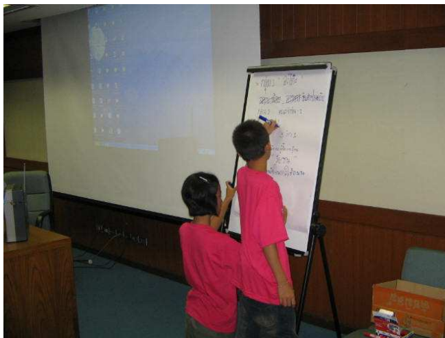
หัวข้อที่จะออกไปสัมมนาของกลุ่มผมครับ