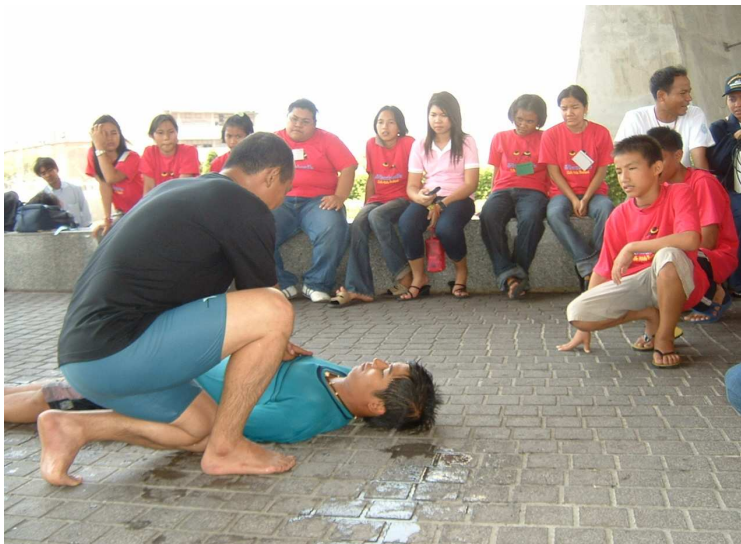
สาธิต ปฐมพยาบาลคนจมน้ำ