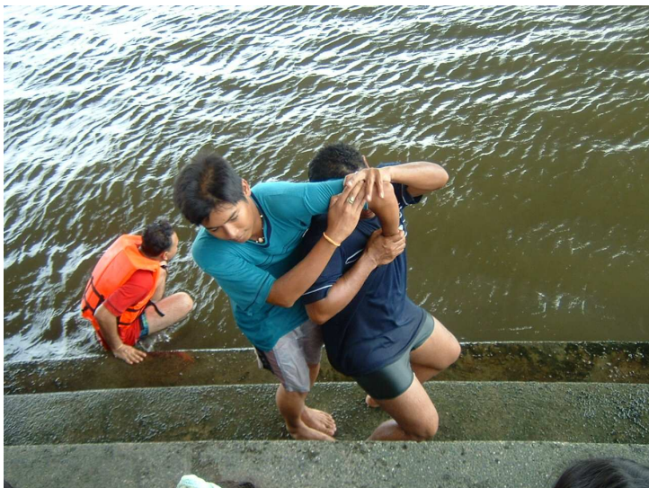
สาธิตการช่วยเหลือคนจมน้ำ