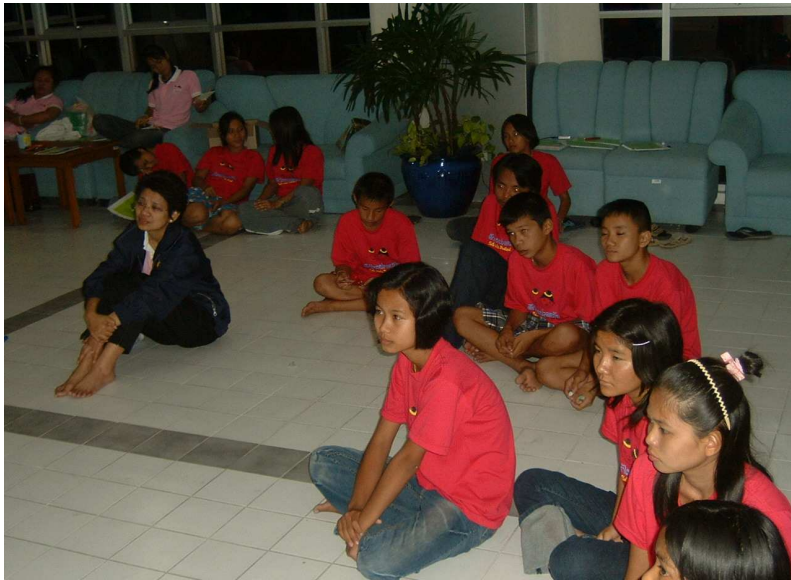
จู้ จู้ ต้งอก ต้งใจฟังเพื่อน นำเสนองานกันอยู่ค่ะ