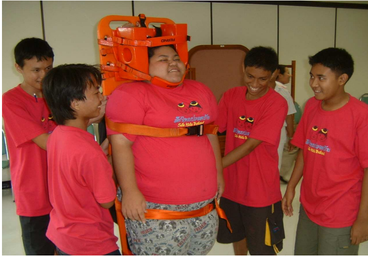
แหนมคอนเมืองค้ำบ แหนมคอนเมือง สด สด ค้ำบ