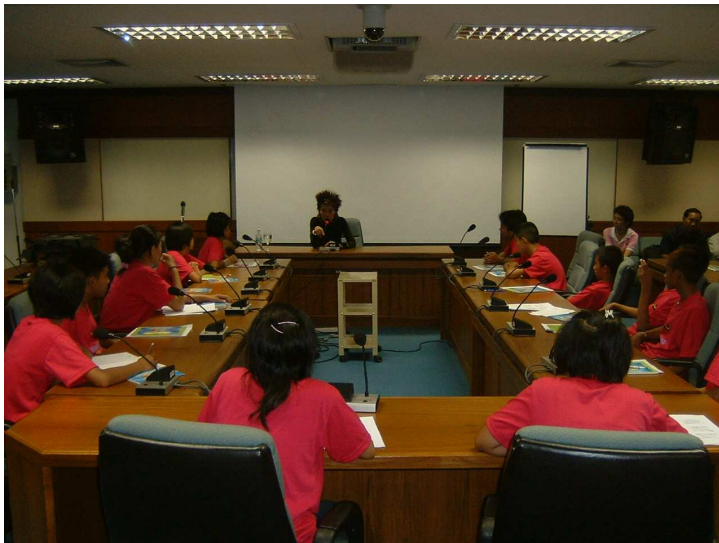
พวกหนูงูจกดูแล ตนเอง และทำความดีเสมอ