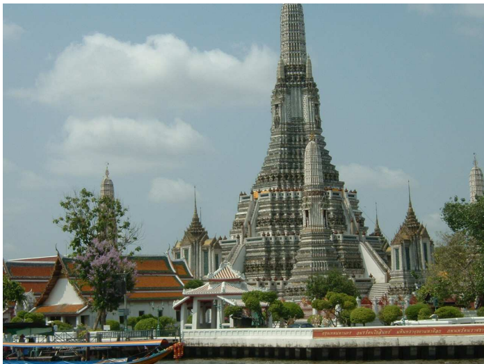
โบราณสถานริมฝั่งแม่น้ำ