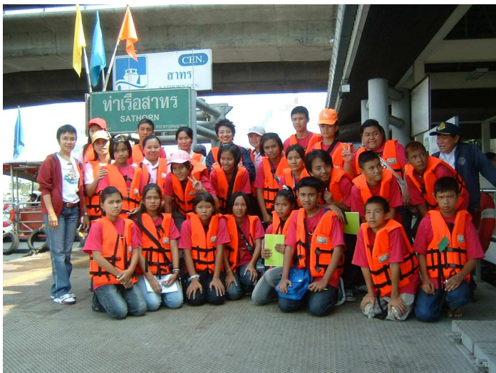
เยี่ยมชม ท่าสาทร ท่าที่มีมาตรฐานที่สุดในประเทศไทย