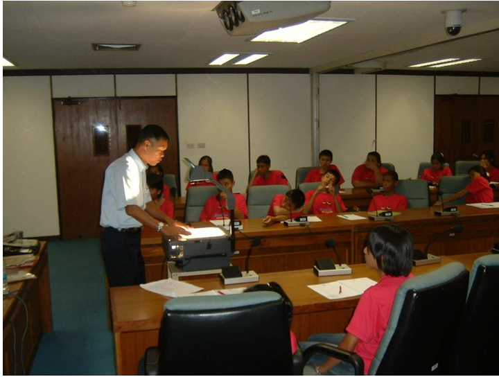
ขอเปลี่ยน อริยาบถ หน้อยนะคร้าบ