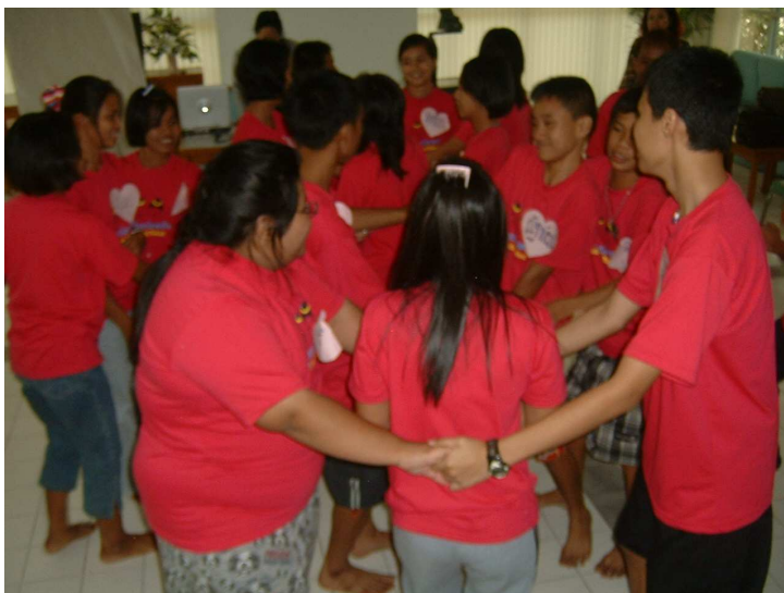
เกมหอยระเบิดมาแว้ว..