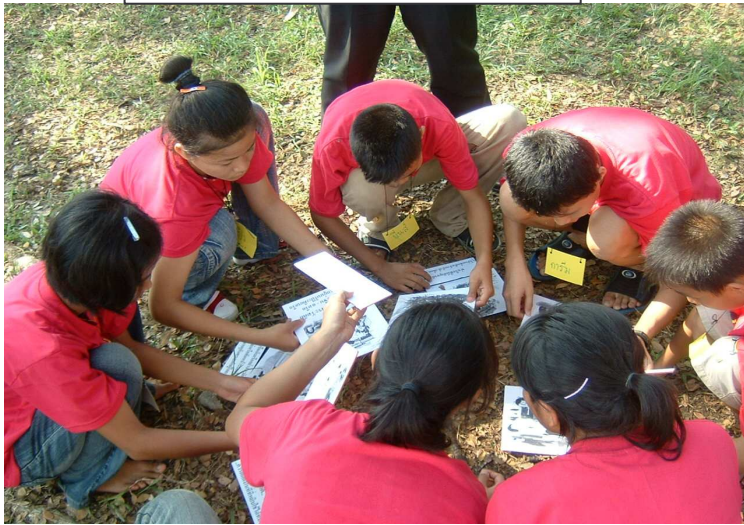
เกมวิชาการทดสอบความรู้