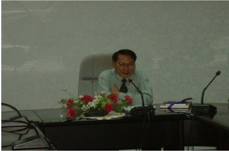
ท่านรองอธิบดี กรมการขนส่งทางน้ำ ให้เกียรติมาเปิดการอบรม