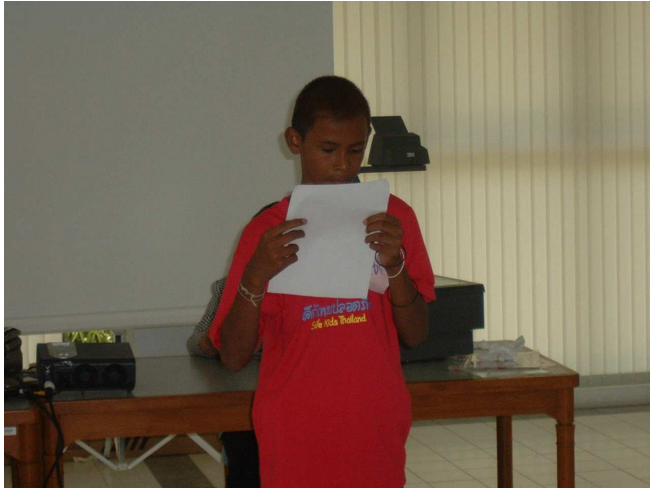
สุดท้าย ออกมารายงานคร่ำบม