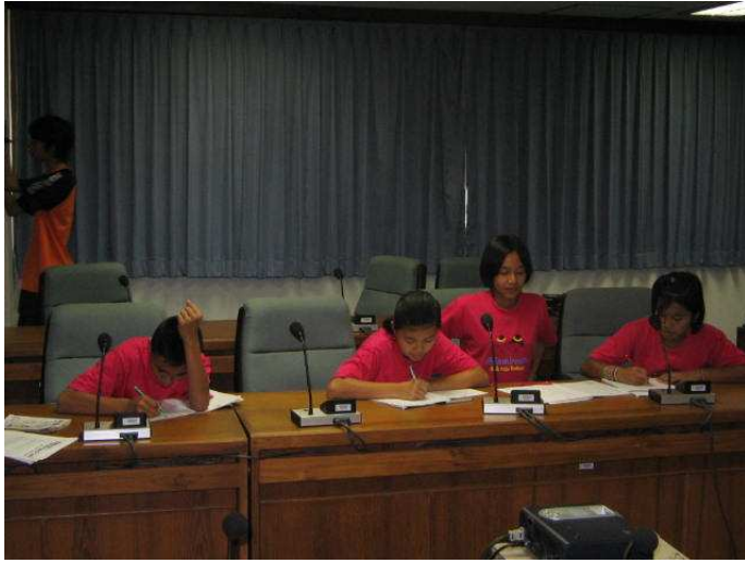
จดเอาไว้ก่อน ฟอสอนไว้