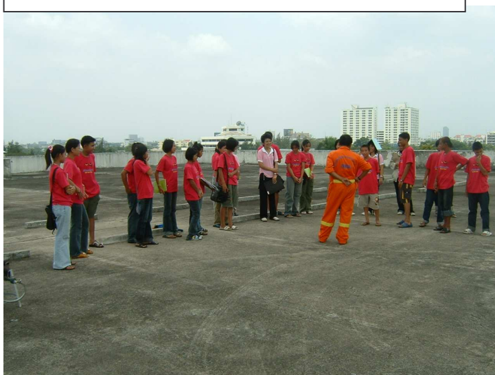
คุณตำรวจ สรุปลักษณะการดับเพลิง