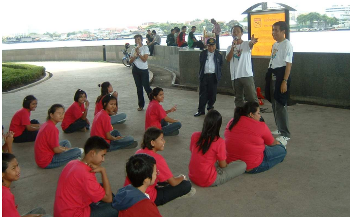
ลงเรือทำกิจกรรม ที่ได้สะพานพระราม 8