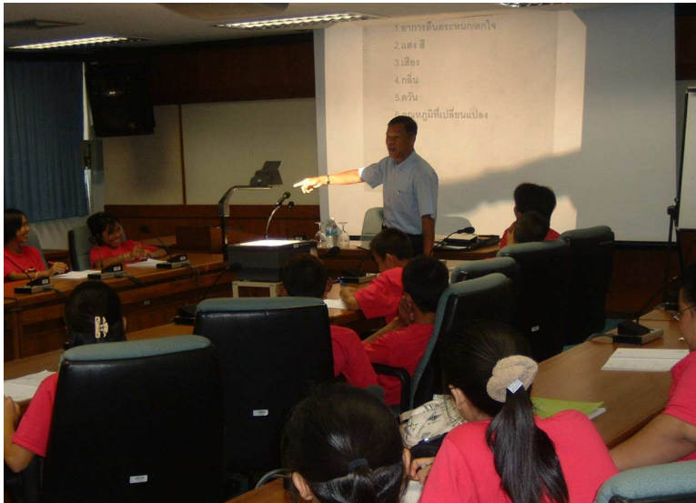
ฮ่า ๆ ๆ ๆ ได้ความรู้ด้วย ขำด้วยคะ เอ๊ก ๆ ๆ !!