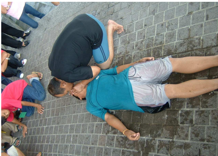
บึ้ย !! เสียวโวย