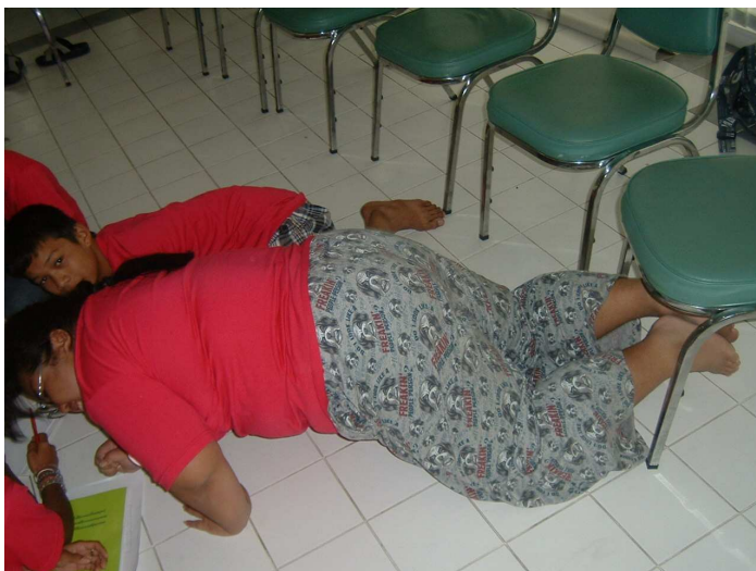
กลุ่มนี้ มีก้อนอะไรกลมๆ กลิ้งอยู่ด้วย