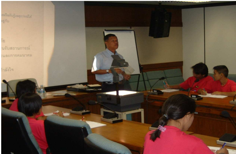
วิทยากร จากกองกำกับการดับเพลิง มาให้ความรู้ เรื่อง การซ่อมแผนฉุกเฉิน