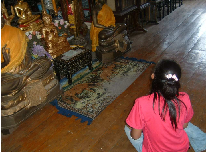
แวนนัมสการ พระพุทธรูปที่วัดเกาะเกร็ด