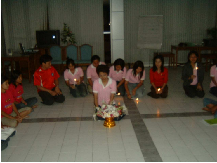
พิธีบายศรีสู่ขวัญ จากพี่ ให้น้อง