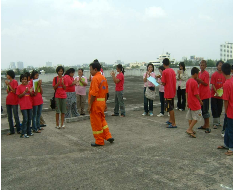
เด็กไทย ปลอศคภย ขอบคูนคูนตำรวจ ค่ะ