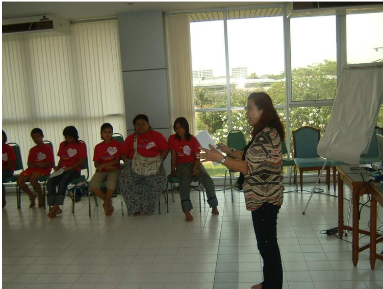
วิทยากรสรุปปิดกิจกรรม