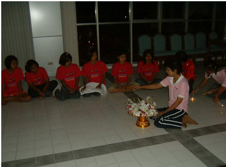
ขอให้น้องๆ ไม่สามัคคีกันเหมือนดอกไม้ไฟนี้