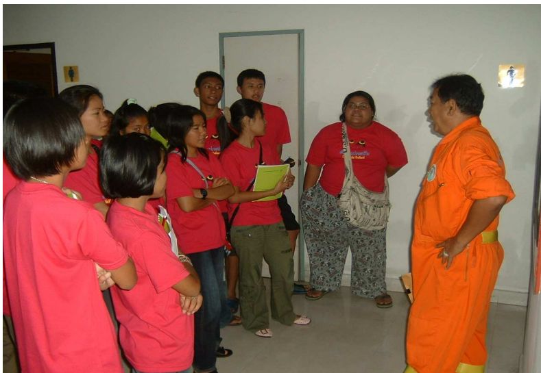
ถ้าไฟไหม้ หนุขนนจะวิ่งทันรีเปล่าคะ คุณตำรวจ