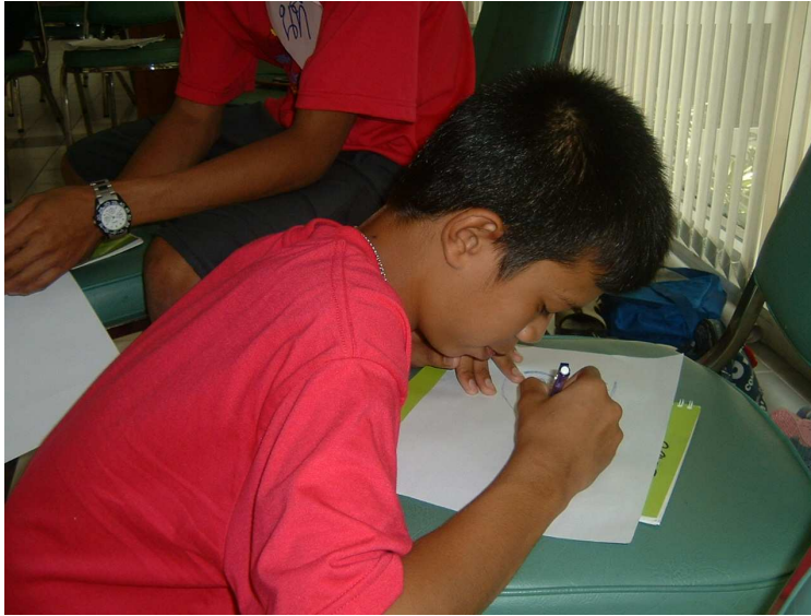
กำลังวาดหน้าตัวเองอยู่ค่ะ