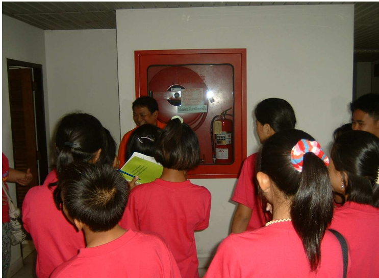
อธิบาย เกี่ยวกับอุปกรณ์การดับเพลิงในอาคาร