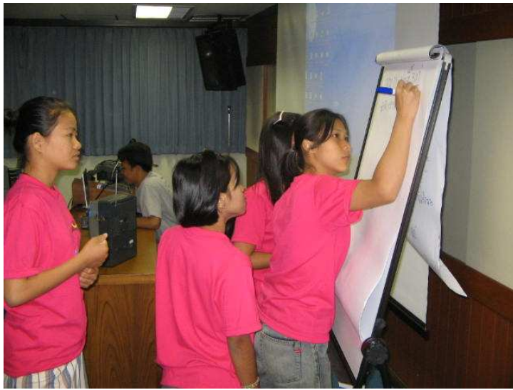
ออกมาเขียนหัวข้อการสัมมนา