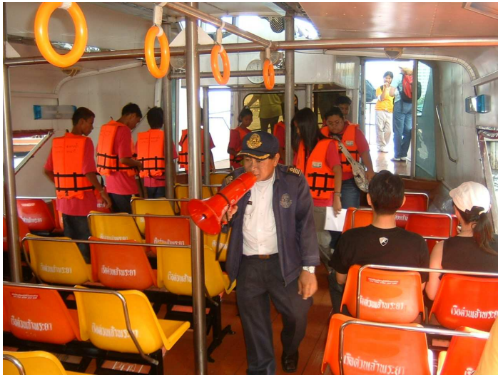
เยี่ยมชม เรือที่มีมาตรฐานความปลอดภัย