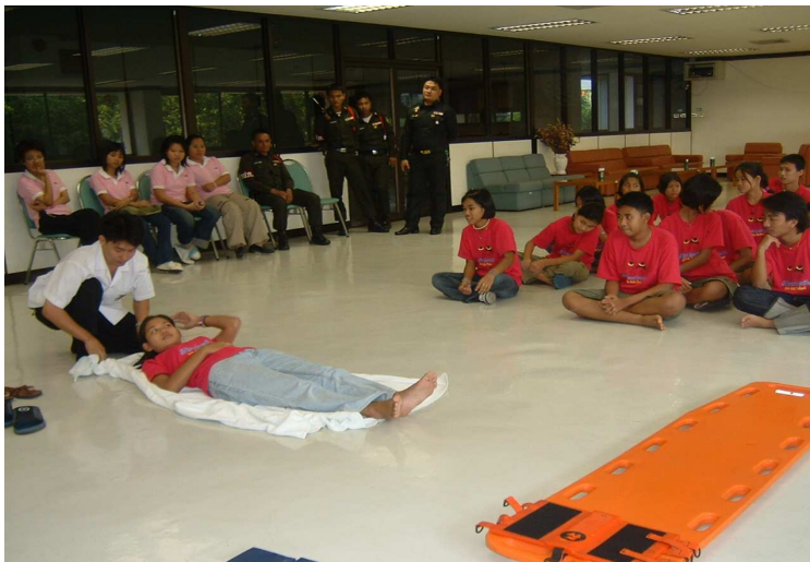
อู๊ย ! เดี่ยวกะพี่ หนุกันหัว สะะ