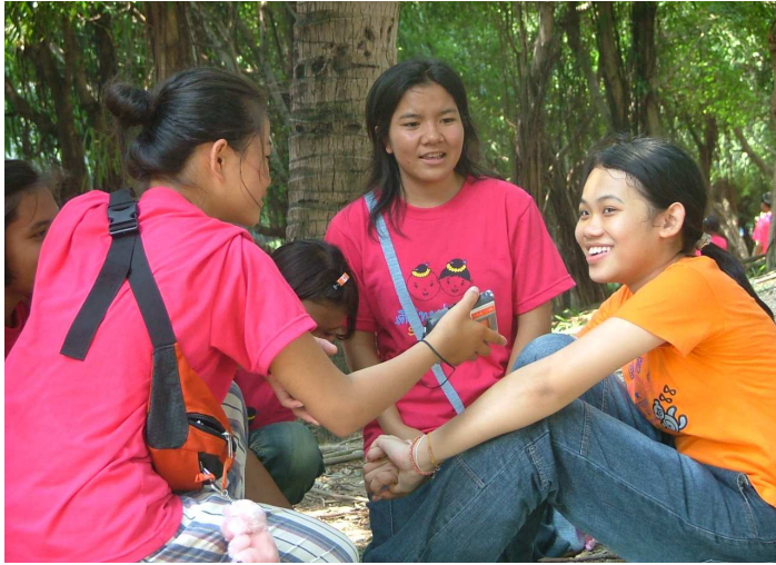
แสะ พี่เงินจั่งเลขค่น้อง