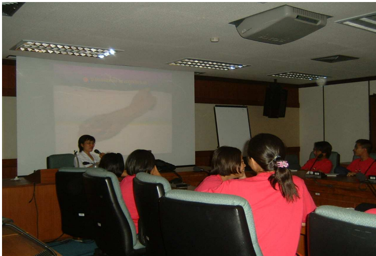
อบรม การปฐมพยาบาลและกู้ชีพ วิทยากร จาก แผนกฉุกเฉิน ร.พ.นพรัตน์