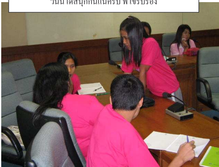
ปรึกษาหารือ หัวข้อการสัมมนา