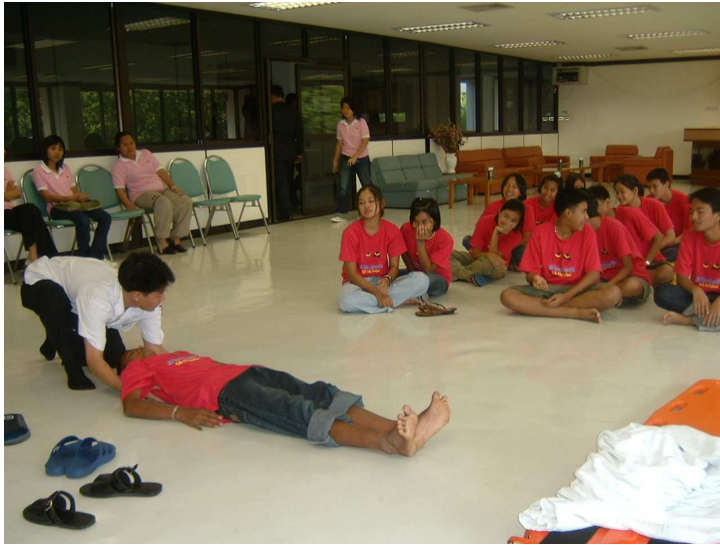
สาธิตการเคลื่อนย้ายผู้ป่วย แบบไม่มีอุปกรณ์