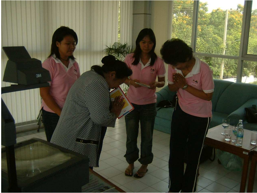
ขอบคุณมากค่ะ ที่ให้ความรู้กับเด็กๆ