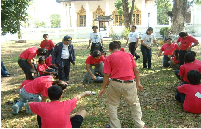
เดิน เดิน เร็ว กลุ่มอื่น เขาเจอเหรียญแก้ว