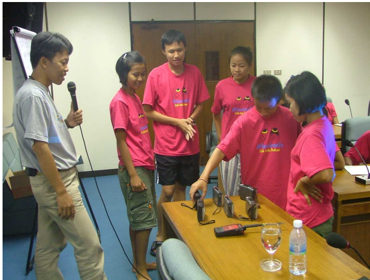
เข้า น้องๆ ออกมาเลือกอุปกรณ์หากินก่อน ครับ