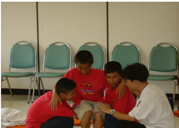
อธิบายการเคลื่อนย้ายผู้ป่วย ที่มีน้ำหนักเบา