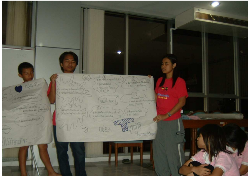
อะแหม่ม ! งานกลุ่มกระผมขอรับ ยินดีนำเสนอ