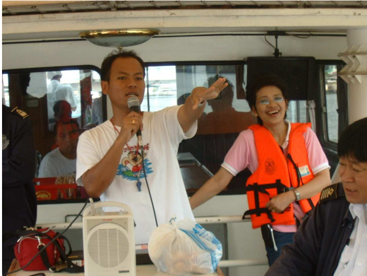
วิทยากรแนะนำสถานที่ริมฝั่งแม่น้ำเจ้าพระยา