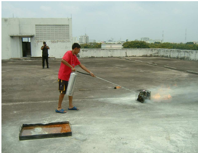
วิธีการใช้ถังดับเพลิงแบบน้ำคาร์บอน