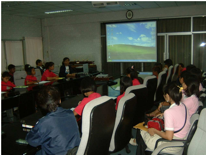
วีดิทัศน์แนะนำกรมการขนส่งทางน้ำ