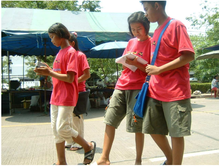
เด็กไทยปลอดภัย นुकูลยตลาดนัด