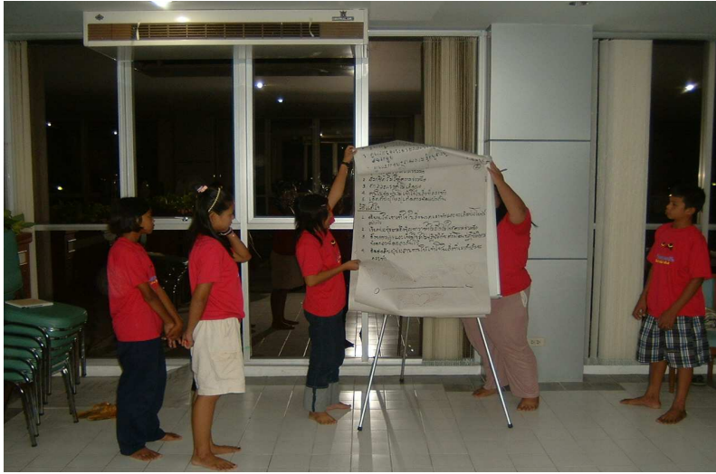
กลุ่มพี่ บิ๊ก ขอนำเสนองานเข้าค่ะ