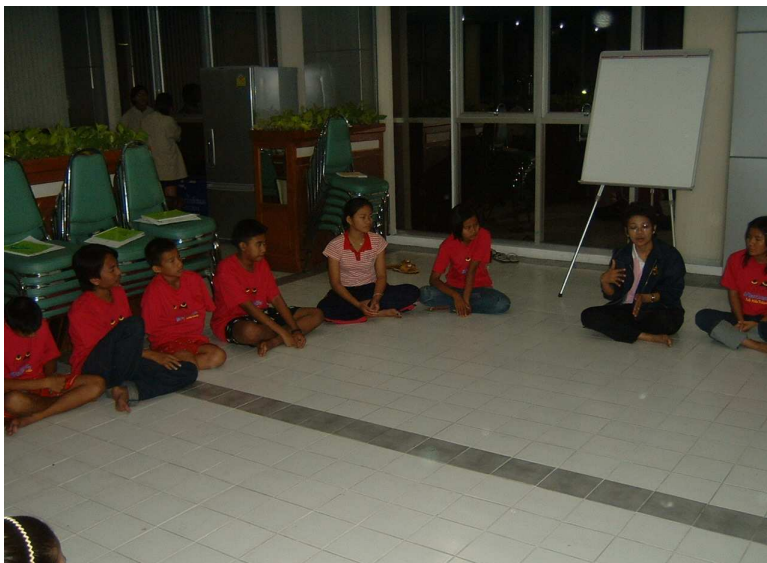
พี่ตุ๊ก ให้คำแนะนำเพิ่มเติม