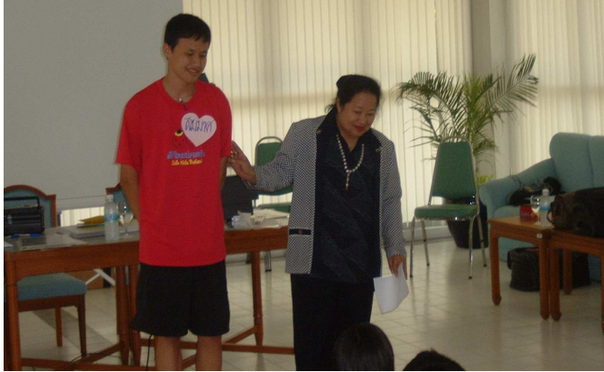
คนนี้หะรอคะ หล่อสุดในค่าย