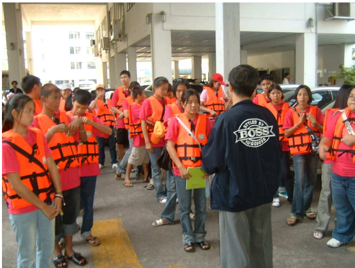
พร้อมลงเรือหรือยังครับ เด็กๆ