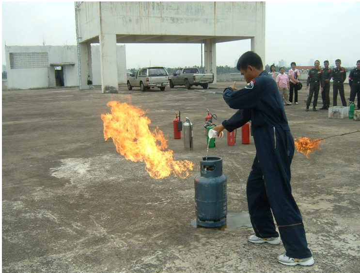
สาธิตการดับเพลิง ที่เกิดจากก๊าซรั่ว