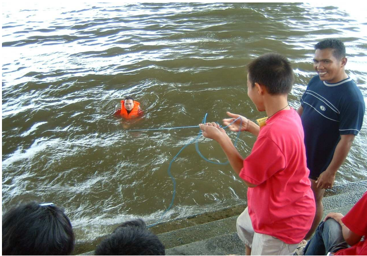
ผมทำถูกต้องไหมครับ พี่