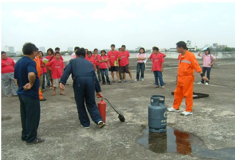
เฮ้ !! ใครจะเข้ามาทดลองทำบ้าง