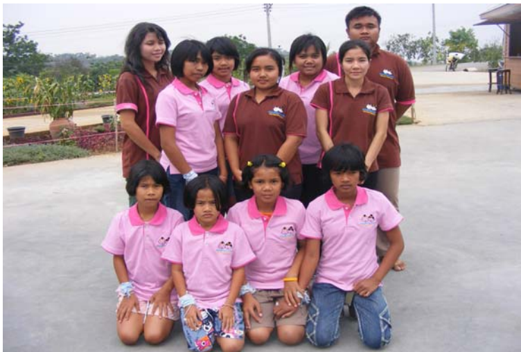
ชมรมเด็กไทยปลอดภัย ตำบลหนองกง จ.บุรีรัมย์