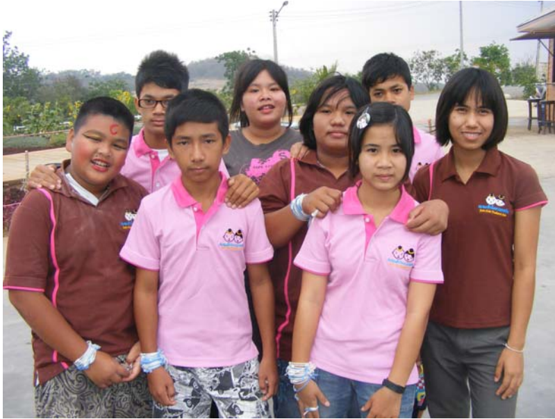
ชมรมเด็กไทยปลอดภัย ตำบลไทรช้อย จ.พิจิตร โลก