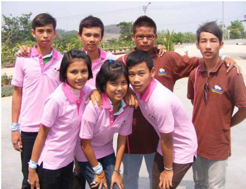
ชมรมเด็กไทยปลอดภัย ตำบลตลาดเกรียบ จ.อยุธยา