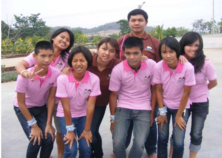
ชมรมเด็กไทยปลอดภัย ตำบลเกาะจันทร์ จ.ชลบุรี