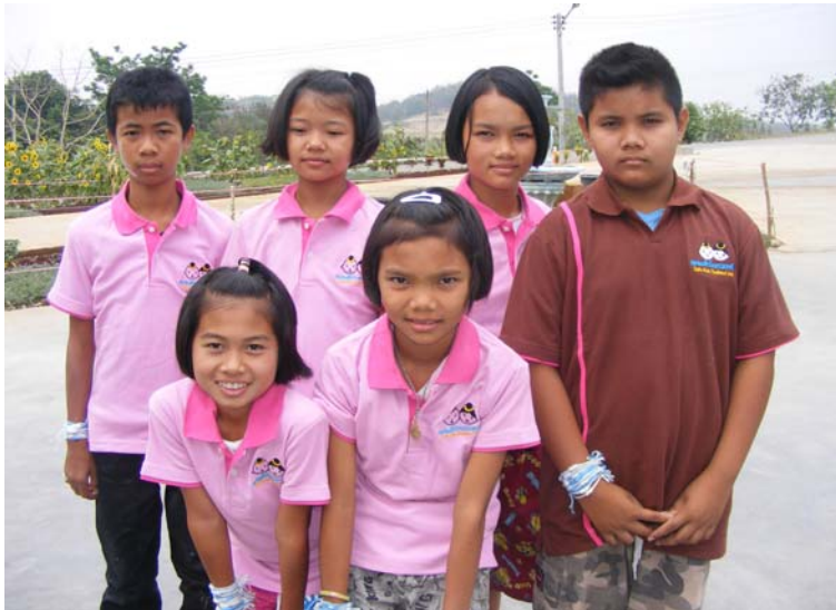
ชมรมเด็กไทยปลอดภัย ตำบลทุ่งมหาเจริญ จ.สระแก้ว