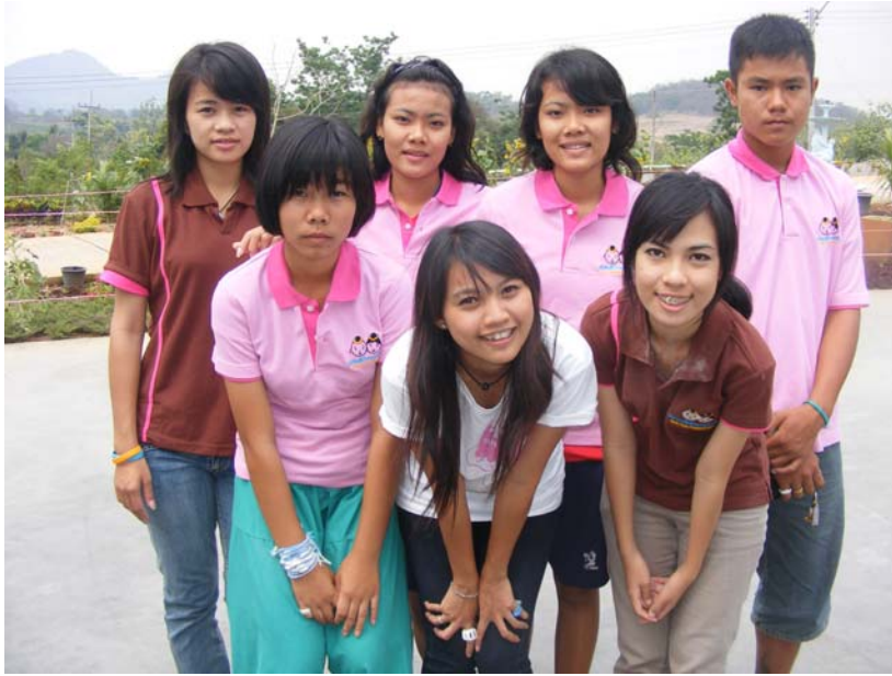
ชมรมเด็กไทยปลอดภัย ตำบลวังทรายพูน จ.พิจิตร