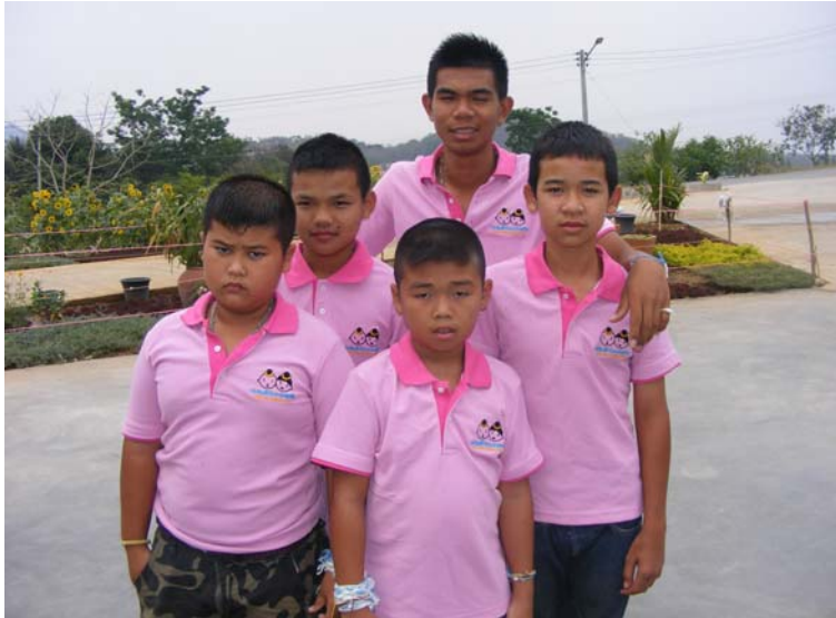
ชมรมเด็กไทยปลอดภัย ตำบลวังสมบูรณ์ จ.สระแก้ว