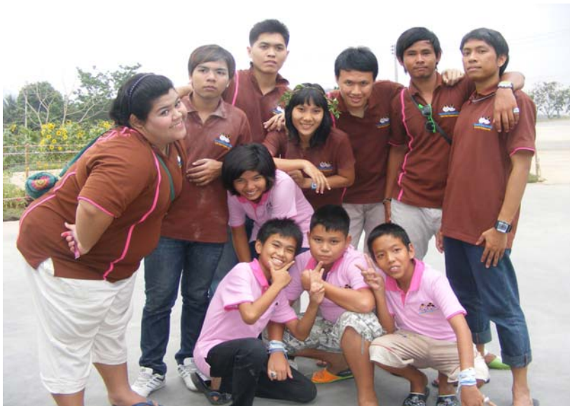
ชมรมเด็กไทยปลอดภัย แขวง ทุ่งพญาไท กทม.